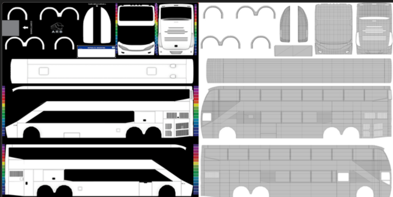
Wireframe e modelo base para texturização