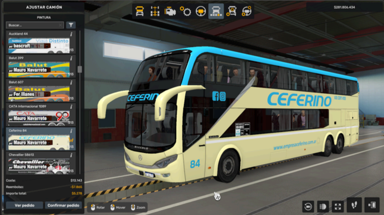
Aba de seleção de pinturas

Recomendação: Sempre comece pela pintura ao personalizar. Algumas configurações podem ser redefinidas se a pintura for alterada depois. A seleção de chassi e sensor só está disponível na pintura branca (00) e nos slots do Skin Edit.