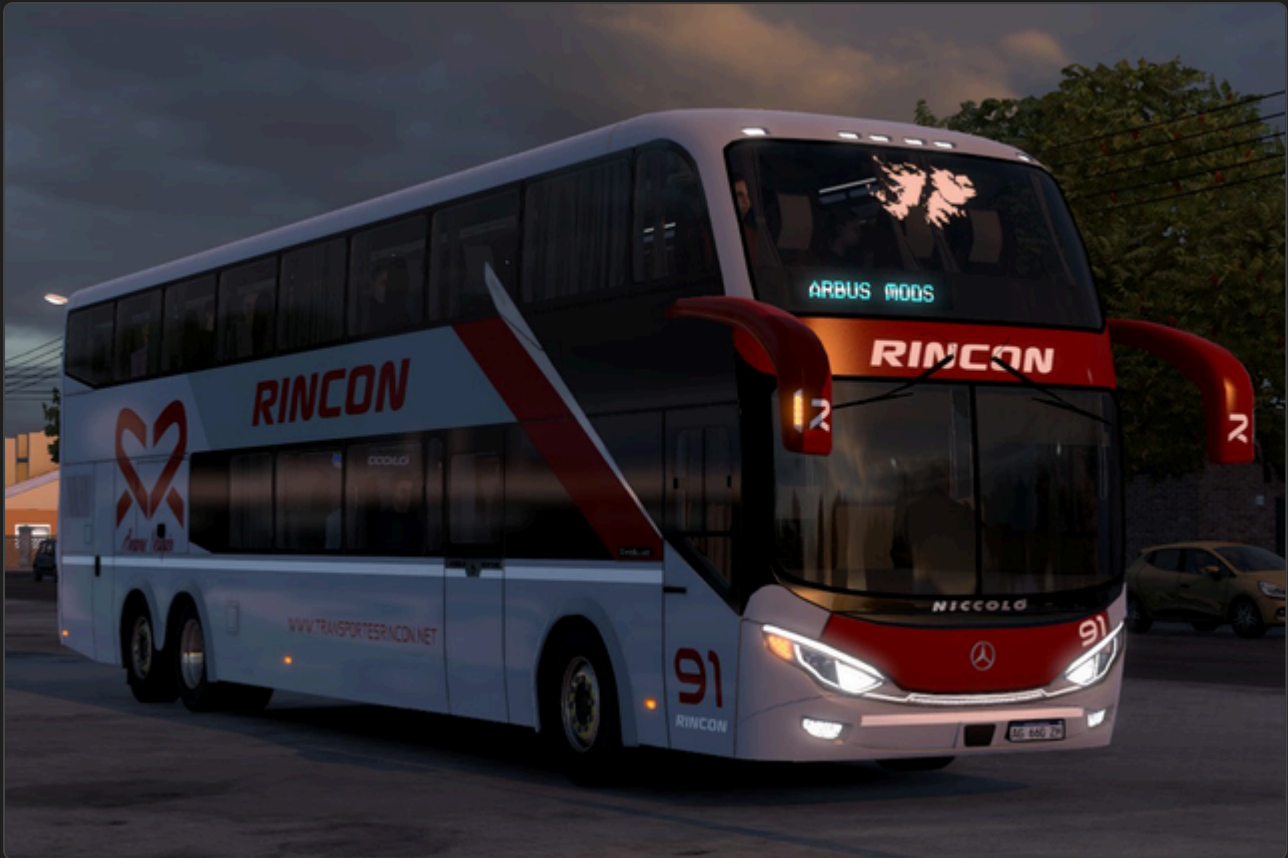
Vista frontal del Niccoló New Isidro 3

Bienvenido al manual del mod Niccoló New Isidro V3 para Euro Truck Simulator 2 . Este documento proporciona información complementaria, así como un paso a paso, para aprovechar todas las funciones del mod.