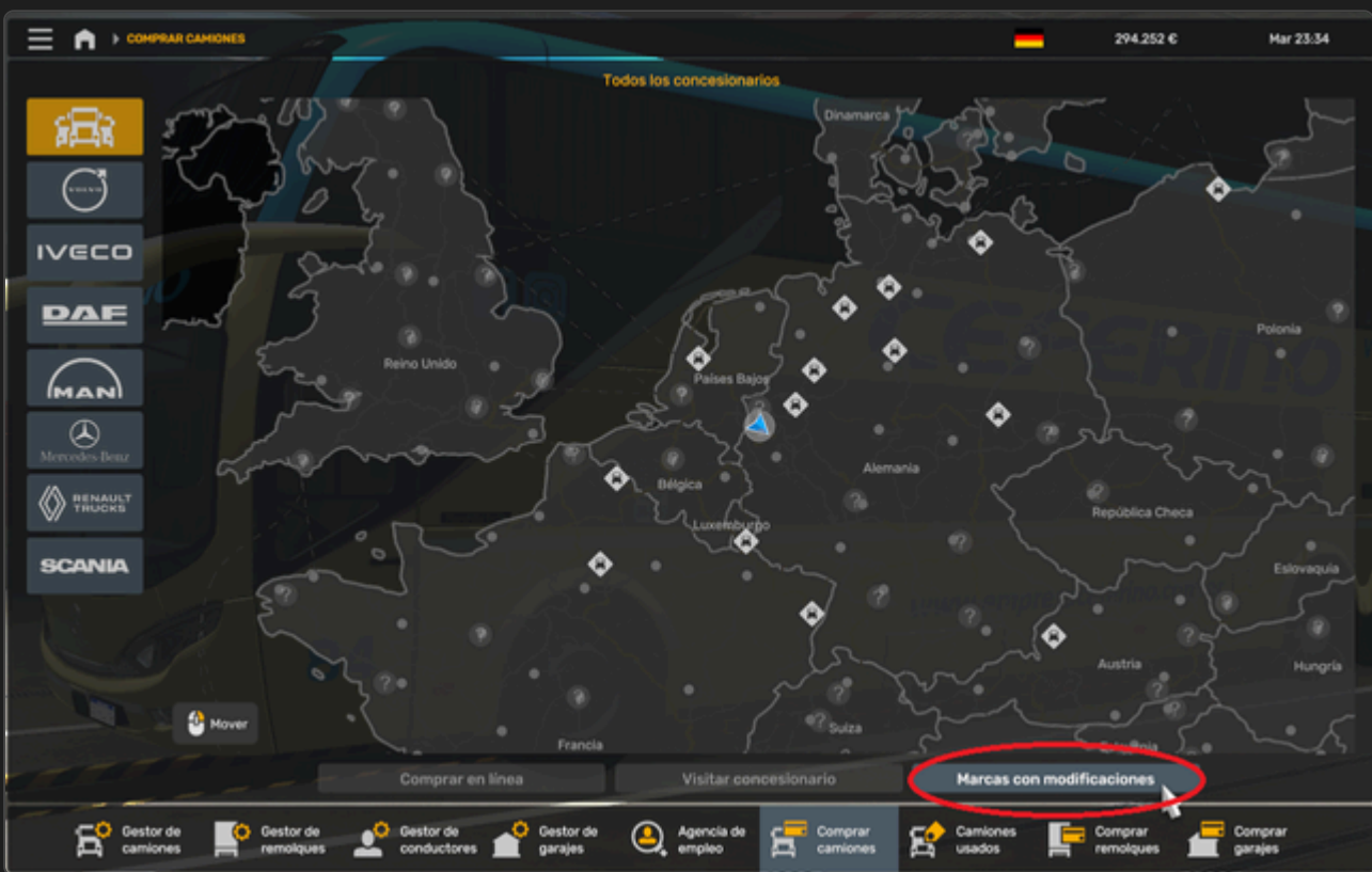
Location in the purchase menu

Note: The truck purchase option becomes available once you complete the tutorial and your first delivery.