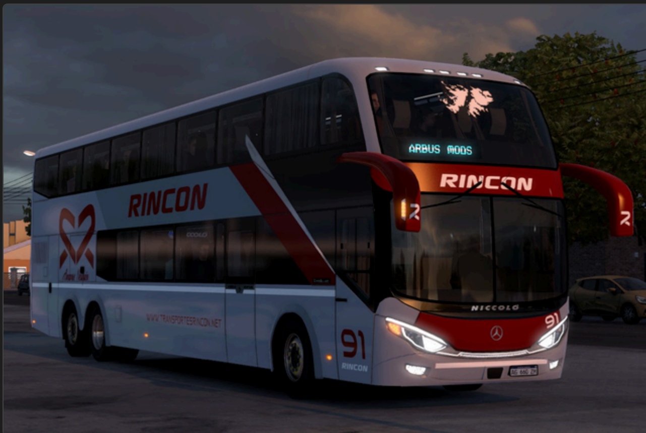
Vista frontal do Niccoló New Isidro 3

Aviso: Esta tradução foi gerada automaticamente. Algumas expressões ou nomes de menus podem não corresponder exatamente ao texto do jogo, e podem ocorrer imprecisões contextuais ocasionais.